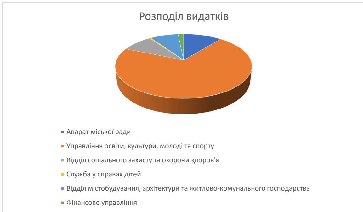
Малюнок 3. Структура видатків бюджету Липовецької міської ради на 2021 р.