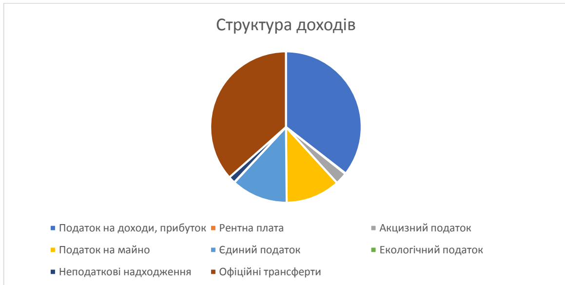
Малюнок 2. Структура доходної частини бюджету Липовецької міської ради у 2021 р.

Лева частина видатків міського бюджету становлять видатки на відділ освіти, культури, молоді та спорту – 123,3 млн. грн. (70 %), де основна частка припадає на освітню галузь – 112,0 млн. грн. В цілому цей бюджет можна охарактеризувати як бюджет проїдання, адже основна частина витрат пов'язана з виплатою заробітної плати персоналу, а видатки на розвиток не перевищують 3,0 млн. грн.