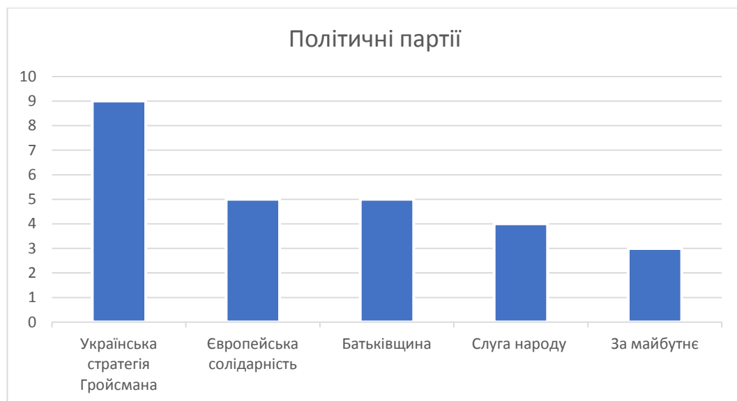
Малюнок 1. Розподіл депутатів Липовецької міської ради за партіями